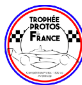
ASSEMBLÉE GÉNÉRALE ASSO AVENIRCUP