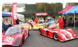
16 TPF ENGAGÉS MAGNIFIQUE PLATEAU