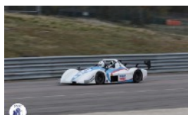
OLIVIER TABONE NOUVELLE VOITURE