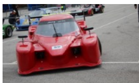
SAMUEL AUTUCHE RETOUR EN FORCE