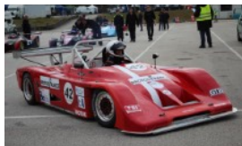
FREDERIC VIGUIÉ CARTON PLEIN