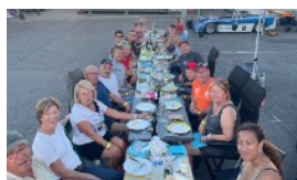
GRILLADE DU SAMEDI SOIR BIENVENUE DANS LE NORD