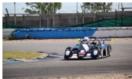
UN NOUVEAU PROTO AMAURY BEAUCHAMP