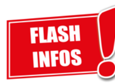
NOUVELLES DU FRONT ACTUALITÉ ET ROULAGE