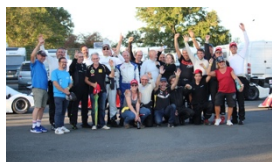
UN FAMILLE SUPERBE AMBIANCE