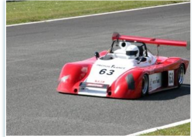
Voiture : SEREM v858 Année : 1985 Moteur : Toyoya Celica 1600 cc Pilote : Xavier DUVIGNAU