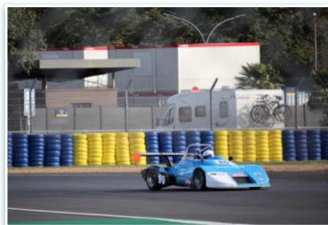
Voiture : ARC MF12 Année : 1984 Moteur : Alfa Romeo 1490cc Pilote : Lionel MARTINUCCI