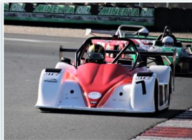
Voiture : FUNYO F5 Année : 2012 Moteur : Peugeot 206 RC – 2L Pilote : Sebastien LEDUC