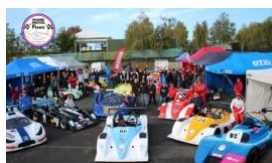
25 PROTOS ENGAGÉS INTERECURIES 2023