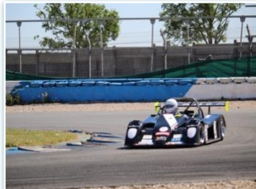
Voiture : FUNYO F4 Année : 2008 Moteur : Peugeot 206 RC – 2L Pilote : Sacha BEAUCHAMP