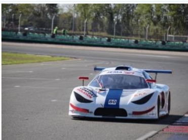
Voiture : JEMA 630 GT Année : 2011 Moteur : Suzuki GSXR 1000 cc Pilote : Fabrice LEOTY