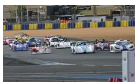
11 NOUVEAUX PILOTES BIENVENUE AUX NOUVEAUX