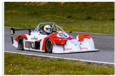
Vainqueur C.P 2023 Voiture : FUNYO F5 Année : 2007 Moteur : Peugeot 206 RC – 2L Pilote : Louis MAINGUY

Nous devrions retrouver ces 3 vainqueurs lors de la remise des prix FFSA 2023. Cette soirée organisée chaque année par la Fédération Française du Sport Automobile se déroule comme chaque année à Paris devant plus de 1 000 invités. Au total, plus de 300 trophées sont remis dont 3 pour le Trophée Protos de France.