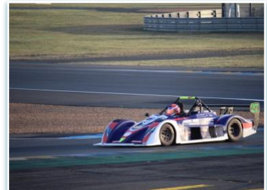
Voiture : FUNYO F5 Année : 2012 Moteur : Peugeot 206 RC – 2L Pilote : Julien LEBEAUPIN