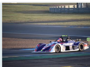
Voiture : FUNYO F5 Année : 2012 Moteur : Peugeot 206 RC – 2L Pilote : Julien LEBEAUPIN