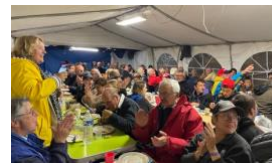
ASSEMBLEE GENERALE VIVEMENT 2024 !