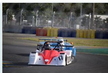
Voiture : FUNYO F5 Année : 2012 Moteur : Peugeot 206 RC – 2L Pilote : Hervé MAITRE