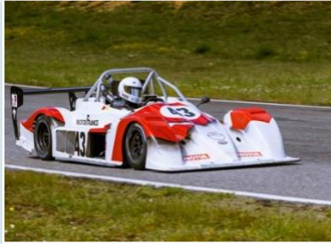
Voiture : FUNYO F5 Année : 2007 Moteur : Peugeot 206 RC – 2L Pilote : Louis MAINGUY