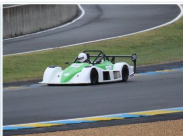
Voiture : FUNYO F5 Année : 2012 Moteur : Peugeot 206 RC – 2L Pilote : Jérôme et Noé FOULFOUIN