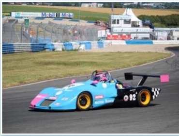
Voiture : ARC MF12 Année : 1984 Moteur : Alfa Romeo 1490cc Pilote : Elodie DURAND