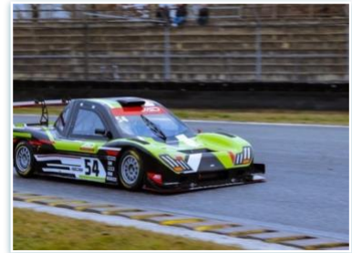
Voiture : JAD LW01 Année : 2022 Moteur : BMW S1000 RR Pilote : Lionel JACOB