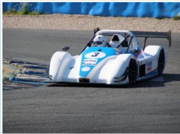
Voiture : RADICAL SR3 RS Année : 2010 Moteur : RPE 1340 cc Pilote : Olivier TABONE