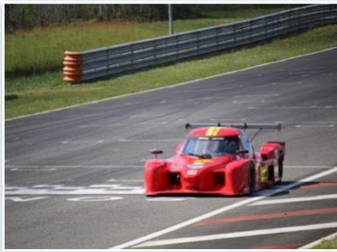
Voiture : JEMA 650 Année : 2019 Moteur : Suzuki GSXR 1000 cc Pilote : Samuel AUTUCHE