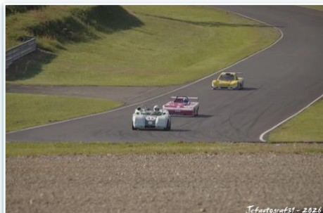
Jefautografst - 2026