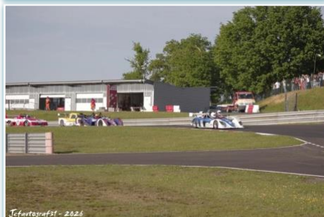
Jefautografst - 2026