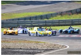
PAU-ARNOS SUCCESSION SPORTIF ET POPULAIRE