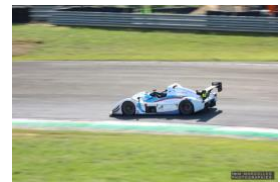
OLIVIER TABONE CARTON PLEIN EN TPF1