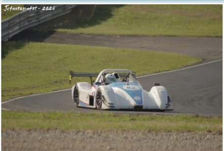
Jefautografst - 2026