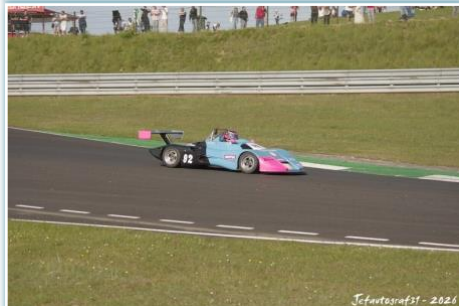
Jefautografst - 2026