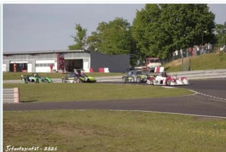
Jefautografst - 2026