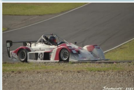
Jefautografst - 2026