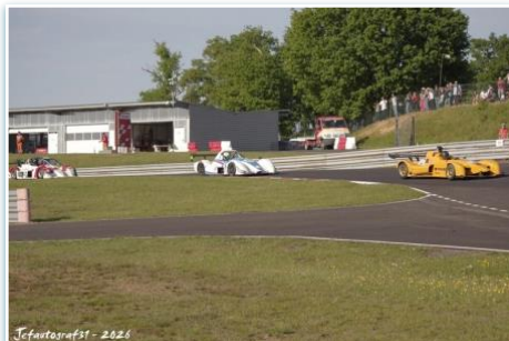
Jefautografst - 2026