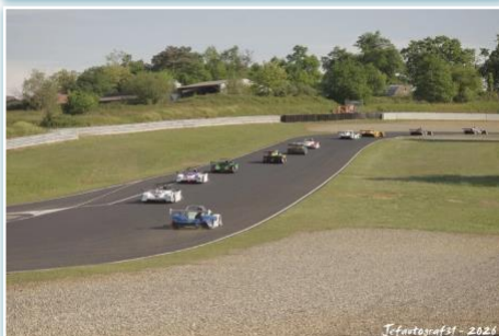
Jefautografst - 2026