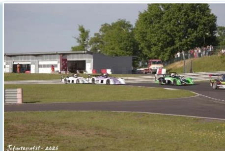
Jefautografst - 2026