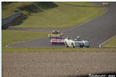
Jefautografst - 2026