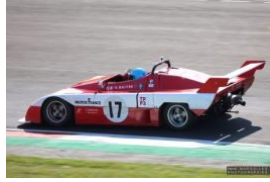
H. MAITRE / J-L. MAINGUY LE MATCH EN TPF3