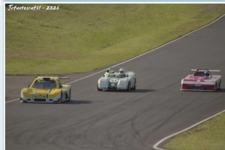
Jefautografst - 2026