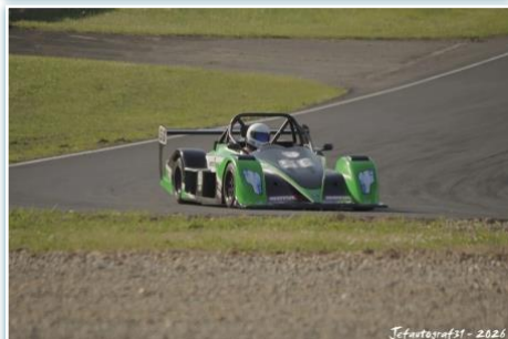
Jefautografst - 2026