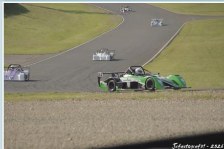
Jefautografst - 2026