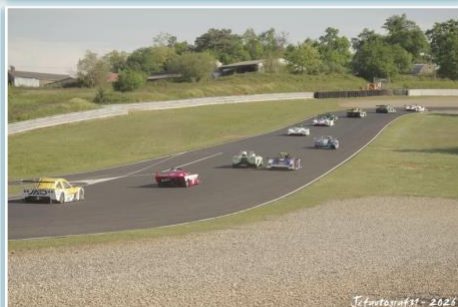
Jefautografst - 2026