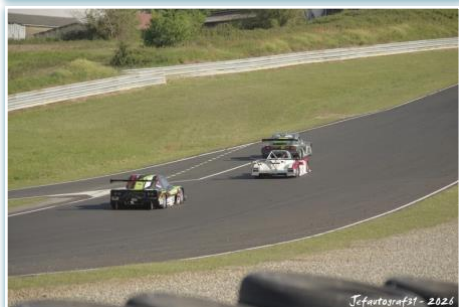
Jefautografst - 2026