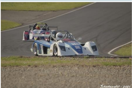
Jefautografst - 2026