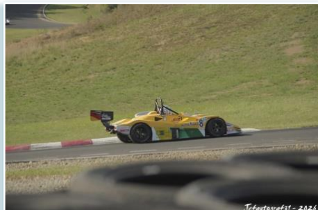
Jefautografst - 2026