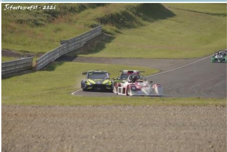
Jefautografst - 2026